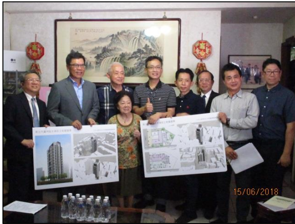
住戶及與會單位合照留影